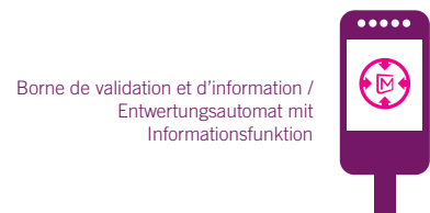
Borne de validation et d'information / Entwertungsautomat mit Informationsfunktion

Pour valider votre titre de transport, vous devez présenter votre mKaart devant une borne. L'affichage positif sur l'écran ainsi qu'un signal sonore indiquent le succès de la validation.