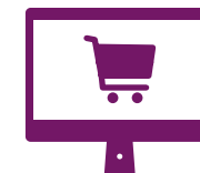
mShop / Webshop