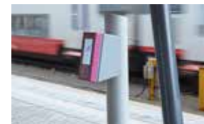
Sur les quais