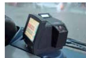
Dans les bus